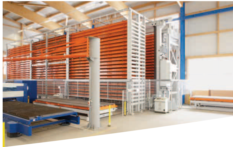
UNILINE: Längslagersysteme zur effektiven Materialbereitstellung an Bearbeitungsmaschinen und zum Kommissionieren.