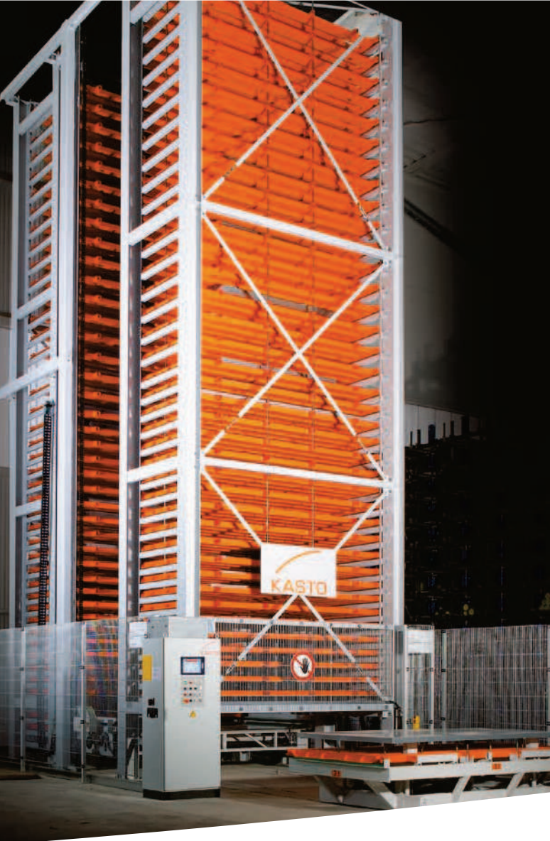
UNITOWER B: Turmlagersystem als platz sparende Lagerlösung für Langgut, Blech, Paletten und vieles mehr