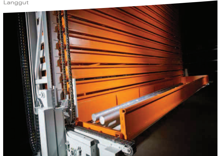
KASTOecostore: kompaktes und standardisiertes Lager für Langgut