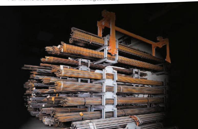
UNIBLOC: Stapeljoch-System mit geringem Platzbedarf. Für kleine bis mittlere Umschlagzahlen.