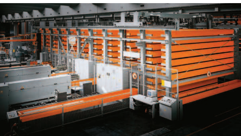
UNITOP: Langgut- oder Blechlager mit oben fahrendem Regalbediengerät. Durch schnellen Zugriff auch ideal als Kommissionierlager.